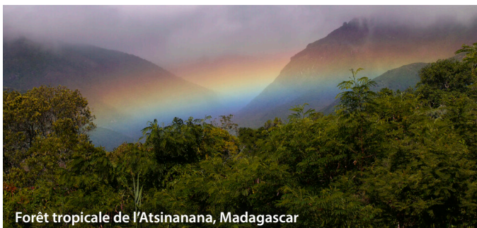
Forêt tropicale de l'Atsinanana, Madagascar