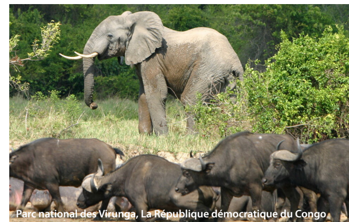
Parc national des Virunga, La République démocratique du Congo