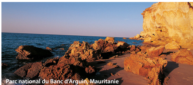
Parc national du Banc d'Arguin, Mauritanie