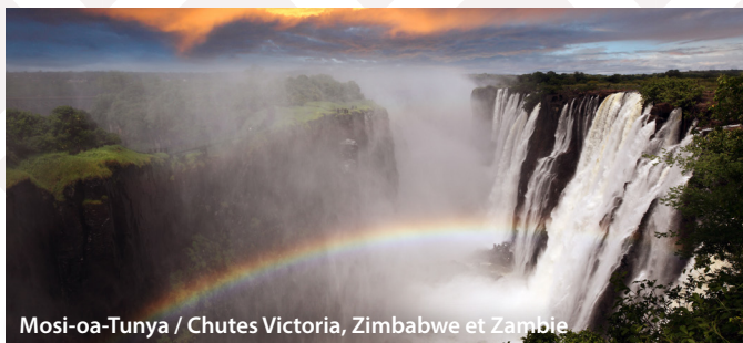
Mosi-oa-Tunya / Chutes Victoria, Zimbabwe et Zambie