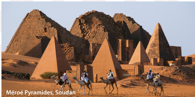
Méroé Pyramides, Soudan